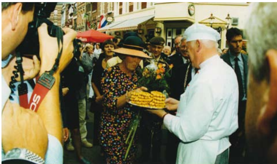
Wafels voor de koningin